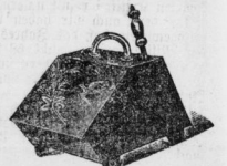
bis zu den feinsten.