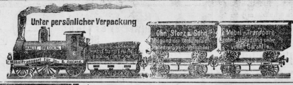
Unter persönlicher Verpackung Halle a/S., Marktstr. 10, I. Halle a/S., Marktstr. 10, I. Halle a/S., Marktstr. 10, I.

Man abonniert auf das täglich 2 mal in einer Abends- und Morgens-Ausgabe erscheinende „ Berliner Tageblatt “ und Handels-Zeitung bei allen Postanstalten des Deutschen Reiches für alle 5 Blätter zusammen für 5 Mark 25 Pfennig vierteljährlich. Probe-Nummern gratis u. franco!