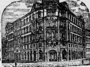
Gesellschaftsgebäude in Leipzig.

Die Lebensversicherungs-Gesellschaft zu Leipzig gehört zu den ältesten und größten, sowie vermöge der hohen Dividenden, welche sie fortgesetzt an ihre Versicherten zahlt, zu den sichersten und billigsten Gesellschaften Deutschlands und steht, was günstige Versicherungsbedingungen anbetrifft, seit Einführung der Lebensversicherung ihrer fünfjähr. Verträge unübertroffen da. Die Beiträge stellen sich bei der Lebensversicherung der Gesellschaft zu Leipzig durch die hohe Dividende auf die Dauer außerordentlich niedrig, und betragen beispielsweise bei einer lebenslänglichen Versicherung von 10000 A nach Eintritt in den 20. Dividendenjahre, d. h. von 6. Ver-