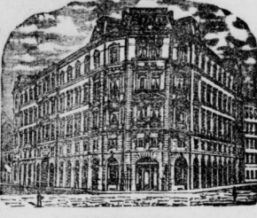
Gesellschaftsgebäude in Leipzig.

Verkehrs- leistung: Geb. 1888: 296 Millionen A. Geb. 1889: 315 Millionen A. Geb. 1890: 336 Millionen A. Verzins: Geb. 1888: 71 Millionen A. Geb. 1889: 78 Millionen A. Geb. 1890: 86 Millionen A.