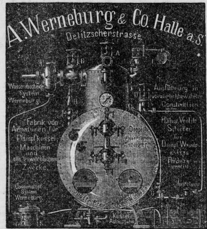
Wir bitten unsere Adresse A. Werneburg & Co., Halle a. S., Delitzscherstrasse, zu beachten.

Andr. Stadtrath, Demuth , Stadterordneter, Richter , Lehrer, Wahlgraben 1a. Mühlweg 17. Böhmischestraße 52. Friedrich , Raue , Karras , Buchdruckereibes. , Schlichter , Prof. Wahlgraben 5. Stemweg 24. Starkestraße 34. Loos , Prof. , Richter , Platonus , G. Senf , Reiter , Antonienstr. 8. Sünder der Ulrichstraße 2. Gr. Ulrichstr. 6. Wierich , Malcr , Al. Steinstraße 1.