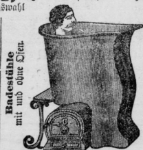
Reibstühle mit und ohne Dampf.