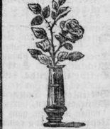
künstl. Rosenstock, täuschend naturähnlich, mit Kristallglas Preis 2.50.