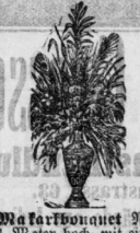
Maaribonquet Nr. 7 1 Meter hoch, mit einem Goldreis bekrönt u. mit Cuirrevel-Blüte. Nr. 350