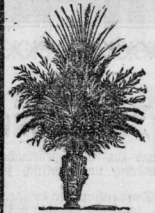
Maaribonquet Nr. 00. Preis incl. Majolikavase (30 cm hoch) 50 &