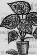
künstl. Wapppflanze, jährlich haltbar, prach- voll gezeichnet. Preis mit Blumentopf 2 &

Planell-Schlafdecken-Special-Geschäft. Lamas, Pferde-, Schlaf-, Sopha-Decken, Stubenläufer und Teppiche in nur haltbarer Waare empfiehlt zu billigen Preisen M. Wehr, Leipzigerstraße 79. Bitte genau auf meine Firma zu achten.