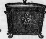
Kohlenkasten und Kohlenkanonen. Reiche Auswahl.