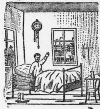
Jamos, weckt vorzüglich.

Grosses Lager von extraf. gold. Taschen-Uhren, silberne Taschen-Uhren in fehr großer Auswahl. Taschen-Uhren in fehr schönen Nidel-Gehäusen mit gutem Werf von 12 Mark an. Garantie: 2 Jahre.