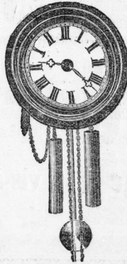
Reparaturen gut und billig.