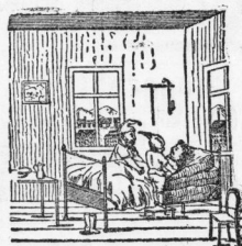
Sah ab, er wird doch nicht wach.