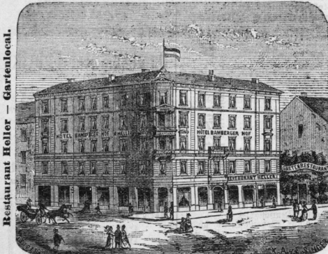
Restaurant Heller — Gartenlocal.

Restaurant Heller, „Bamberger Hof“, Leipzig, Mitte der Stadt — Nähe der Bahnhöfe — Leipzig dicht an der Kunst-Gewerbe-Ausstellungshalle.