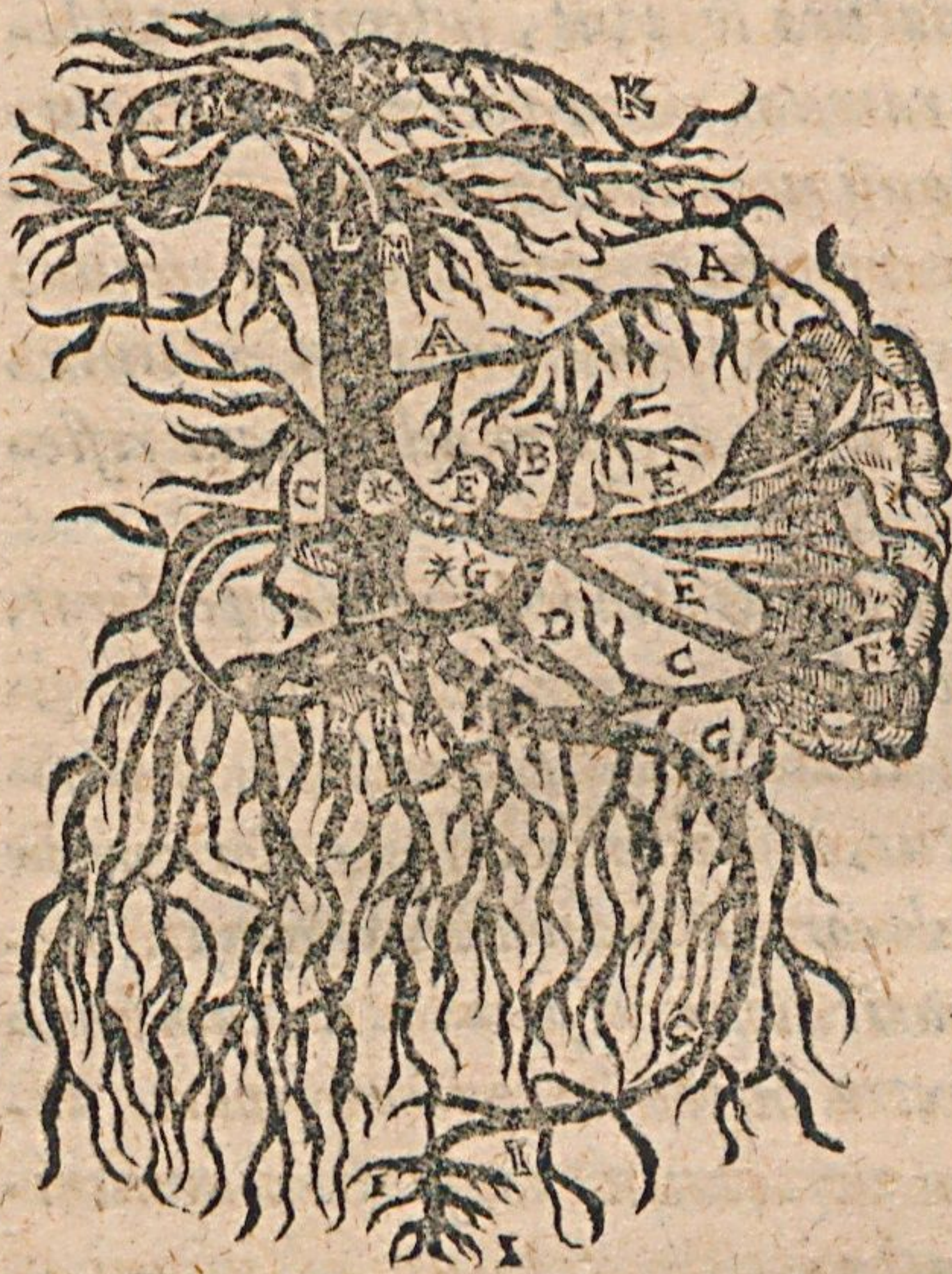
Figura hæc venæ portæ ramos depingit.