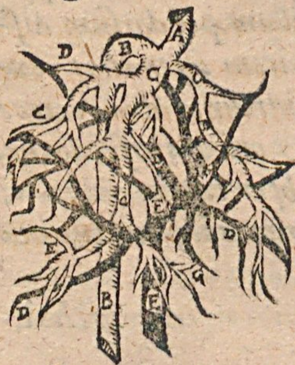
Figura hæc venæ cavæ & portæ radices per hepar sparsas & coeuntes indicat.

13. Has venas omnes natura in truncum magnum transformavit, deinde rursus in quamplurimos ramos, & hos rursus in minimos surculos divisit, ob eam nimirum causam, ut Chylus in Epate detentus mediante vasorum, cavæ scilicet & portæ, plexu, & transitus angustia perfectè in sanguinem transmutari possit.