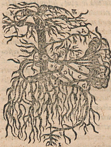
Figura hæc venæ portæ ramos depingit.