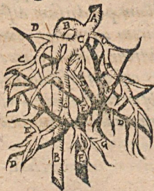
Figura hæc venæ cavæ & portæ radices per hepar sparsas & coeuntes indicat.

13. Has venas omnes natura in truncum magnum transfor- mavit, deinde rursus in quamplurimos ramos, & hos rursus in minimos surculos divisit, ob eam nimirum causam, ut Chylus in Epate detentus mediante vasorum, cavæ scilicet & portæ, plexu, & transitus angustia perfectè in sanguinem transmutari possit.