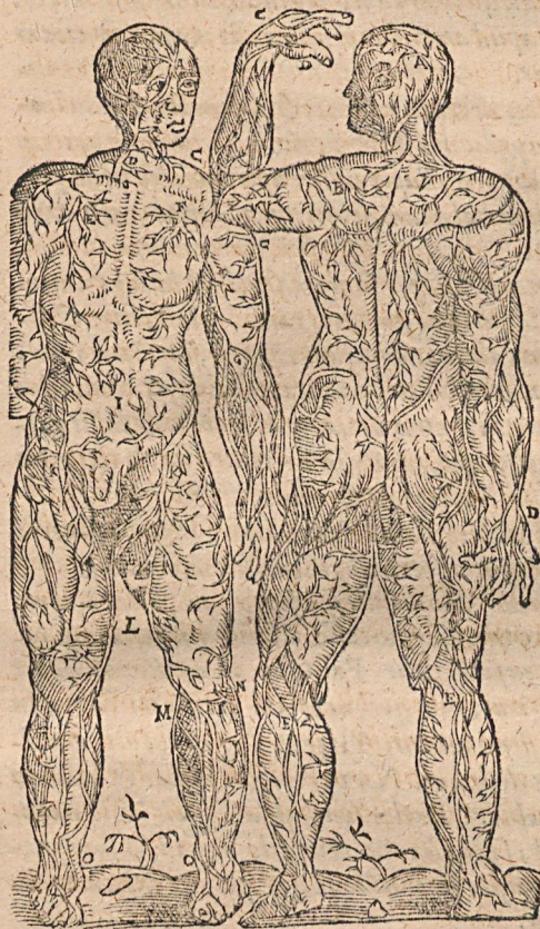
Figura I. anteriores venas externas delineat.