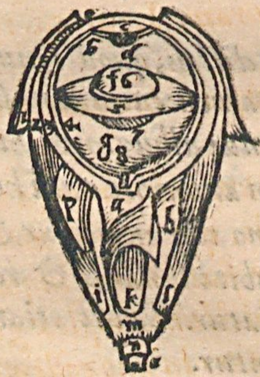
Figura hæc oculum cum suis musculis, tunicis & membranis exhibet.