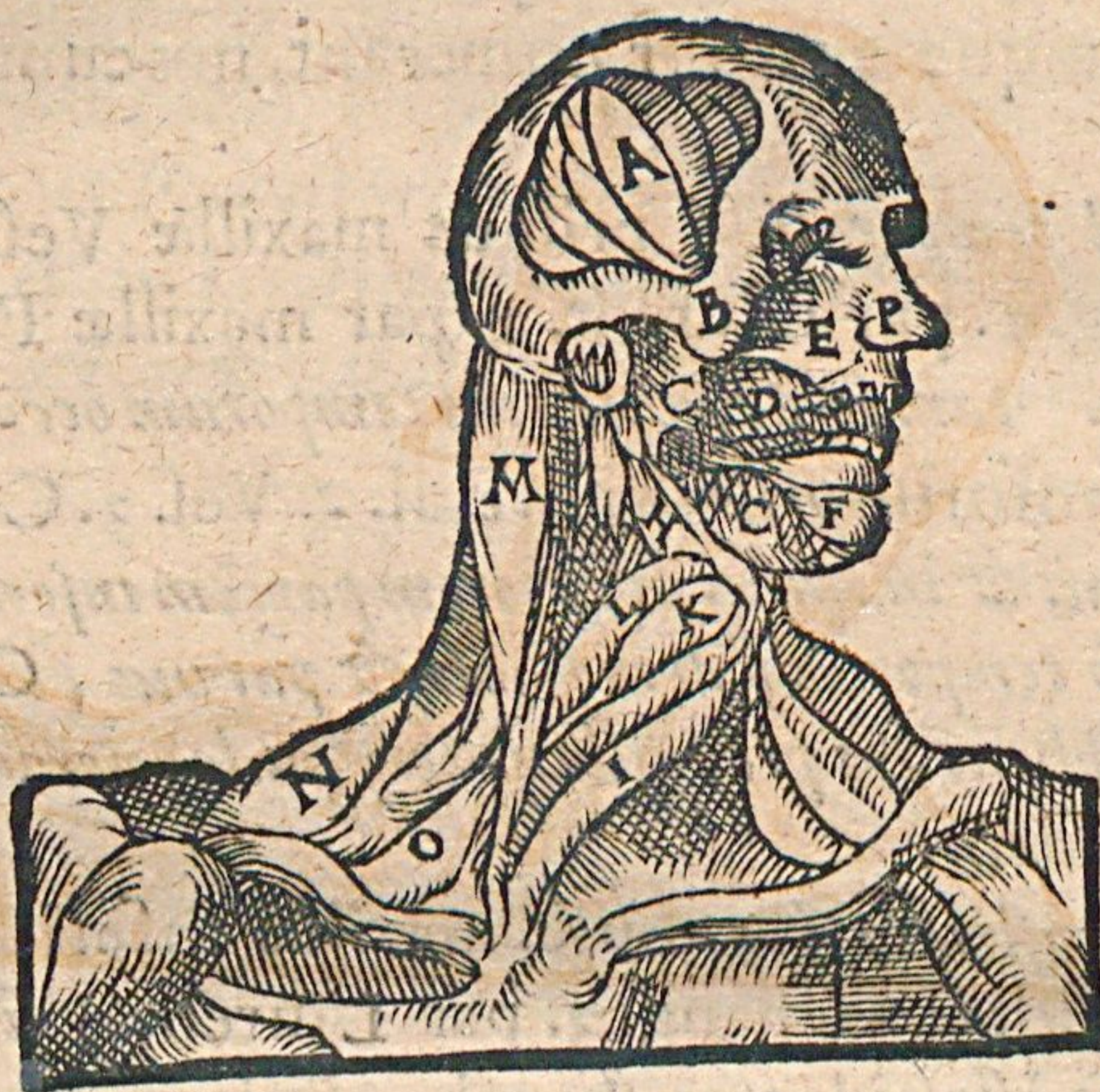
Figura principum faciei musculorum.