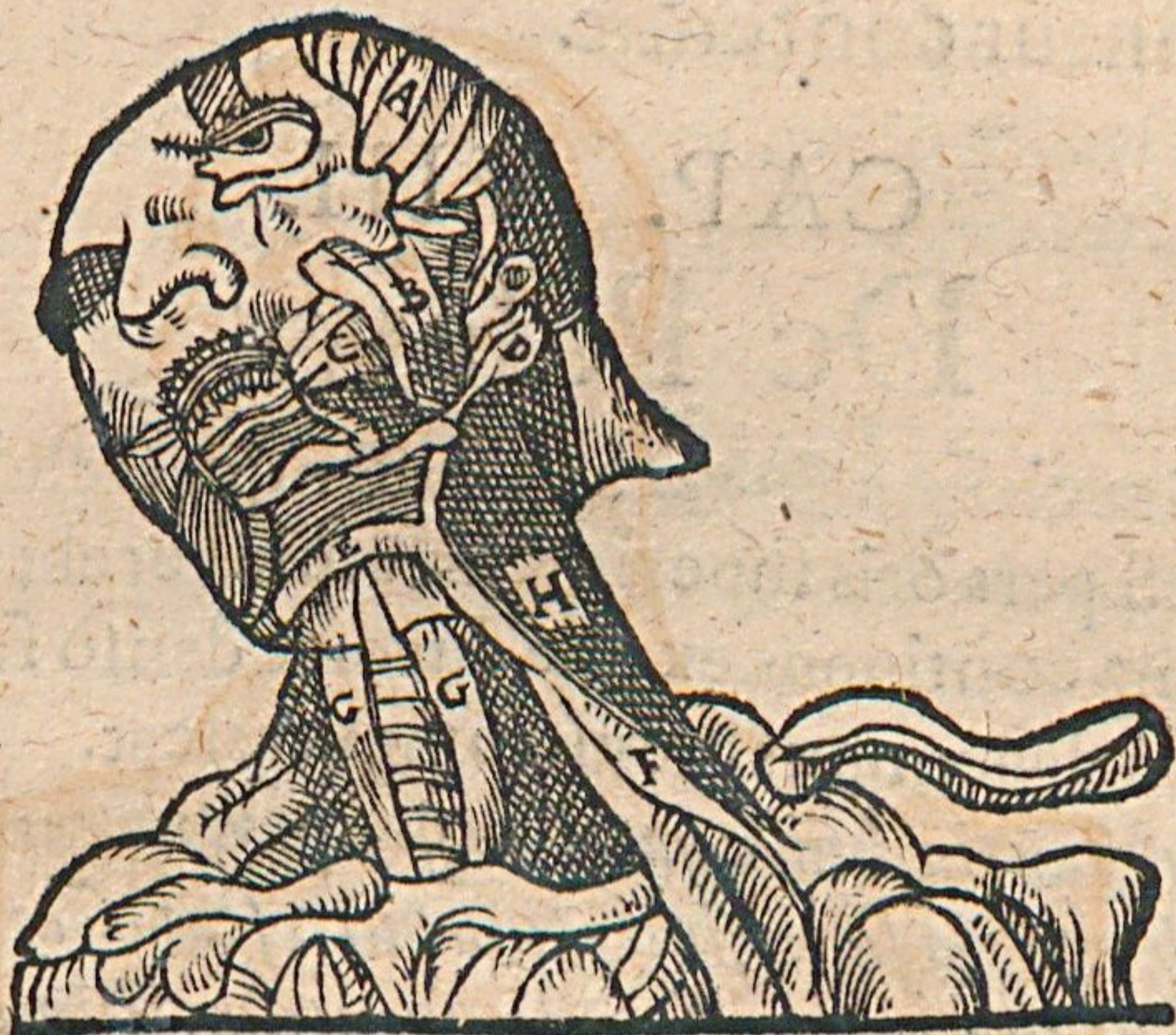
Figura musculorum maxillæ inferioris.