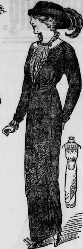
Nachmittagskleid aus rotem weichen Tuch mit reicher Seidenstickerei in b r gleichen Farbe. Der Rock hat seitliche Kesslung und halbe Tunic. Die Taille fällt einfallend und Jakob. Dazu schwarzer Velourhut mit flachgelegter Reiferpannase.

Unzählige Besucher füllten täglich die Ausstellungshallen am Zoologischen Garten, um die dort vorgeführten „alten“ und „neuesten“ Moden zu sehen. Auch ich war vor einigen Tagen dort, um meinen verehrten Leserinnen doch noch etwas Interessantes bringen zu können. „Nachtlos und gerast“ lautet die Parole der neuen Mode. — Viel Neues bringt auch die vorgerückte Saison nicht. Ich sah ein hübsches Modell aus weinrotem Tuch und weicher Seide in der gleichen Farbe aufammengestellt. Der Rock aus 3 Volants, die Taille liegt mit langen Ärmeln und tiefem spitzen Hals-