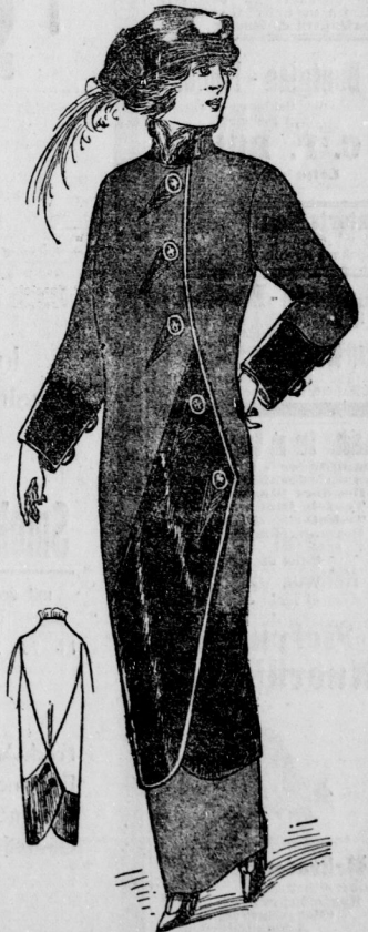
Wintermantel aus Hila Glauchstoff mit angewebtem Futter. Breite Velouchestreifen — Breitfchwanzimitation garnieren den \frac{1}{4} langen Mantel. Dazu kleiner Hut mit Hila Samthut, schwarzem Velouchstrand und flachgelegtem Reifer.