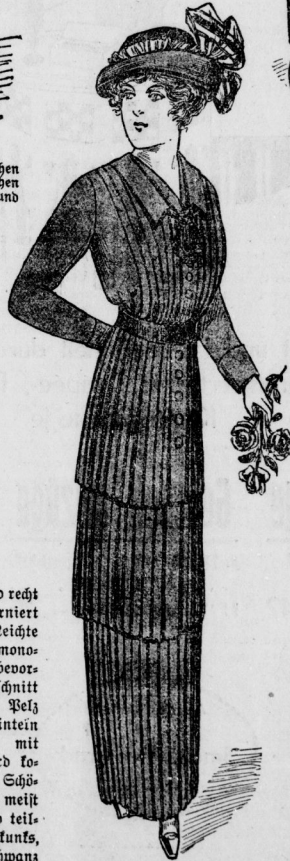
Nachmittagskleid aus plüschtem bleu Voile Ninor auf lachs-farbenen Unterkleid gearbeitet. Der Rock ist aus 3 gleich breiten Volants gearbeitet. Dazu bleu Samthut mit Chinébandgarnitur.

ausschnitt. Die eleganten Abendkleider sind mit Perlstoffen und breiten Spitzen reich garniert. Hier wirkt schwarz mit weißen Spitzen am vorteilhaftesten. Die Kostüme sind teilweise länger, aus rauhen Stoffen mit breiten Wildleder- oder Seidengürteln garniert, jedoch wirkt die vornehme Cutawayform stets elegant. Auch Blusen sind recht reich mit Perlen garniert oder solche eingestickt. Leichte Spitzenblusen im Kimonoschnitt werden sehr bevorzugt, und der Halsausschnitt vielfach mit schmalem Pelz eingefast. In Abendmänteln aus Pelz oder Brotat mit breitem Pelztragen wird soviel viel Apartes und Schönes geboten. Diese sind meist \frac{1}{2} lang, abgerundet und teilweise hochgeschlossen. Stunks, Hermelin und Breitfchwanz