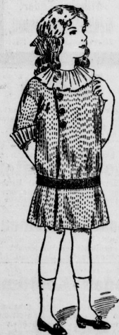
Kinderhänger aus gebütem Wollstoff mit Ledgürtel und Bastströgen und Aufschlägen. — Matrosenanzug aus weißem Cheviot mit Marinetrögen

Hohe Stulpen, aufgesetzte Taillen und ein riesengroßer Schalkragen dürfen natürlich nicht fehlen. Für diese Mäntel werden englische Leder, Affenhauttuch und Homespun gern verwendet. Auch Glauchstoffe wirken gut.