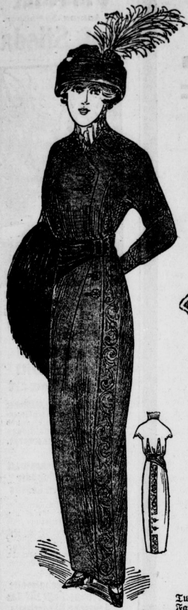
Strassenkleid aus braunem Satin Tuch mit reicher Seidenstickerei in braun und schwarz gehalten. Die breite Bulgaren-schärpe ist schwarz mit Schnalle. Dazu brauner Toque mit hochstehendem Reifer.