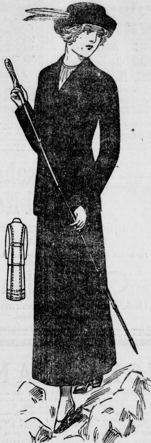
Sportkostüm aus grünem Diagonal mit halblanger englischer Jacke und aufgelegten Taschen. Der Rock ist unten zu schlißen. Dazu schwarzer Samtbolet mit grüner Federhüte.

Taschen. Dazu Pelzgarnierung. Die Hüte werden aus Velour oder Samt gearbeitet. Außer der notwendigen Sportausrüstung erfordern doch diese Reiten noch einige kleine Abendkleider, ja sogar Gesellschaftstoiletten, denn die jetzt modernen Abend-Diners entwickeln eine vornehme Eleganz,