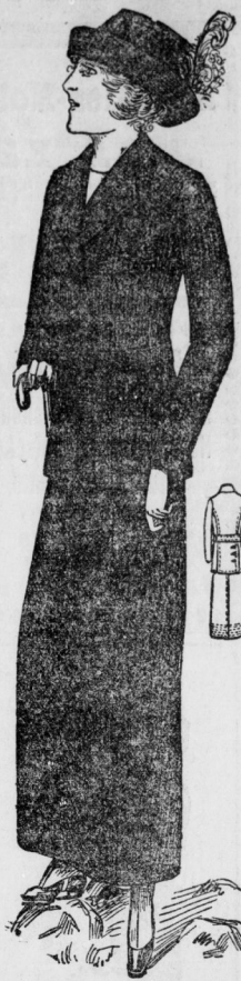
Sportkostüm aus marne Cheviot mit zweiteiligem Rock, englischer Jacke mit Herrensweaters und Taschengarnierung, und losem Gürtel. Dazu marine Velourhüte mit Bandgarnitur und Reiterfantasie.

Taschen. Dazu Pelzgarnierung. Die Hüte werden aus Velour oder Samt gearbeitet. Außer der notwendigen Sportausrüstung erfordern doch diese Reiten noch einige kleine Abendkleider, ja sogar Gesellschaftstoiletten, denn die jetzt modernen Abend-Diners entwickeln eine vornehme Eleganz,