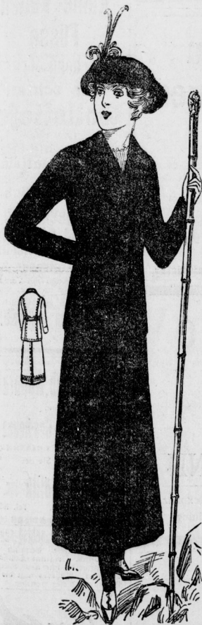
Sportkostüm aus braunem Cordstoff mit englischer Zeile und verrennener, Gürtel und durchgestepptem Rock. Dazu braune Velourhüte, vorne hochgeschlagen.

schwarzen Seidengürtel mit seitlicher Schärpe. Recht vornehm wirkte ein schwarzes Velocetkostüm mit schwarzen, dicken Seidenschürren benäht und kleinem Hermelintragen. Praktisch und auch für diverse Sportzweige zu vereinen ist ein braunes englisches Kostüm mit durchgestepptem 4 Bahnenrock, englischer Sportjacke mit Kiegel und aufgesteppten