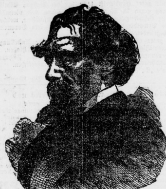
Charles Dickens (Boz).

Bestehen sich: 1. Brausewaare Nr. 31. 2. Handtücher Nr. 16. Speifen werden verabschiedet von 11-1 Uhr mittags. 1 ganze Portion zu 28 Wfg. 1 halbe Portion zu 13 Wfg. Wartten zu ganzen und halben Portionen, welche an beliebigen Tagen in beiden Rüchen vorzubereiten werden können, sind zu haben bei Herrn Kaufmann Hill, Schiffsstr. 68, und bei Herrn Kaufmann Ludwig Barth, Leipzigerstr. 90, beide des Leipziger Summes.