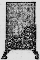
Bilderständer in 100 verschiedenen Sorten, Bildt. von 25, Cabinet von 50 M. an.