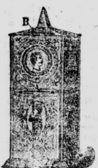
Reinheit! Spar-Automat. Man wirft in den Ein- schnitt B ein Geldstück, geht an der Klappe A, worauf eine Hunderthaler in die Schale G rollt. Preis 50 M.