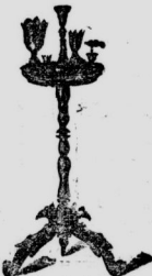
Rauchtische, großartige Auswahl, von 3-27 M. Schirmständer, Tischchen etc.