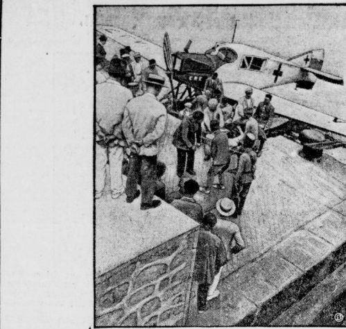
Ähnliche Aufnahme zeigt die Landung eines Flugzeuges vom Kriegsschauplatz Marokko mit Schwerverwundeten in ein ein spanisches Hafen.

Ein Pariser Straßenbrotmeister. In Paris werden neuerdings zur Erleichterung des Fremdenverkehrs in den Straßen Brotmeister aufgestellt, die auf einer Armbrust die Sprache anzeigen, die sie sprechen. Man findet darunter auch Armbrüsten mit Aufschrift: „Man spricht deutsch“.