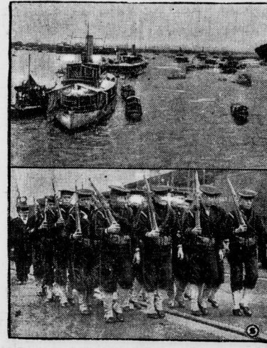
Der Hafen von Shanghai. Unten eine Abteilung Marineinfanterie, die als Besatzung für das dortige amerikanische Generalconsulat bestimmt ist.

Dem deutschen Erfindergeist ist es gelungen, einen Taucherapparat zu konstruieren, mit dem Tiefe erreicht werden können, in die bisher noch niemals ein Taucher gelangte. Versuche im Meeresbecken haben ergeben, daß in einer Tiefe von 100 Metern ein Aufenthalt bis zu 5 St. möglich ist. Aufgaben, welche von der Marine-Kommission des Inn- und Auslandes gestellt wurden, sind zur vollen Zufriedenheit gelöst worden. Besonders in der Perlen- und Perlmutterfischeri und auch bei der Schwammgewinnung wird die Einführung der Panzer-Taucherapparate eine große Umwälzung bedeuten. Aber auch bei der Bergung von Gut aus untergegangenen Schiffen wird diese neue deutsche Erfindung eine große Rolle spielen. Unser Bild zeigt einen Taucher in dem neuen Panzer-Tiefsee-Taucherapparat bei der Arbeit auf dem Meeresgrunde.