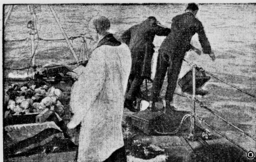
Das Seemannsgrab des englischen Admirals Scott.