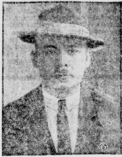
Der Massenmörder Haarmann.