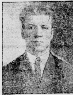
Sein Defensdeshler Grans.