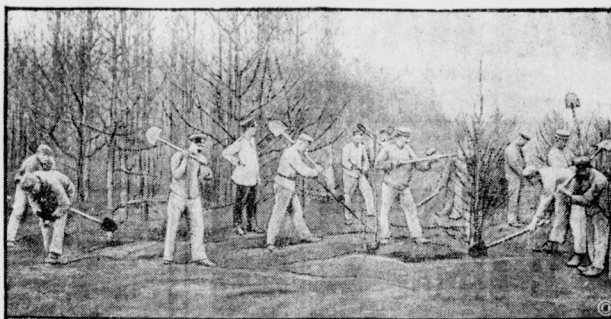
Ein Hilfstupp der Reichswehr schlägt glühende Bäume nieder und erstickt durch Umschneifen des Bodens die sich fortsetzende Glut, um den Brandherd einzudämmen.