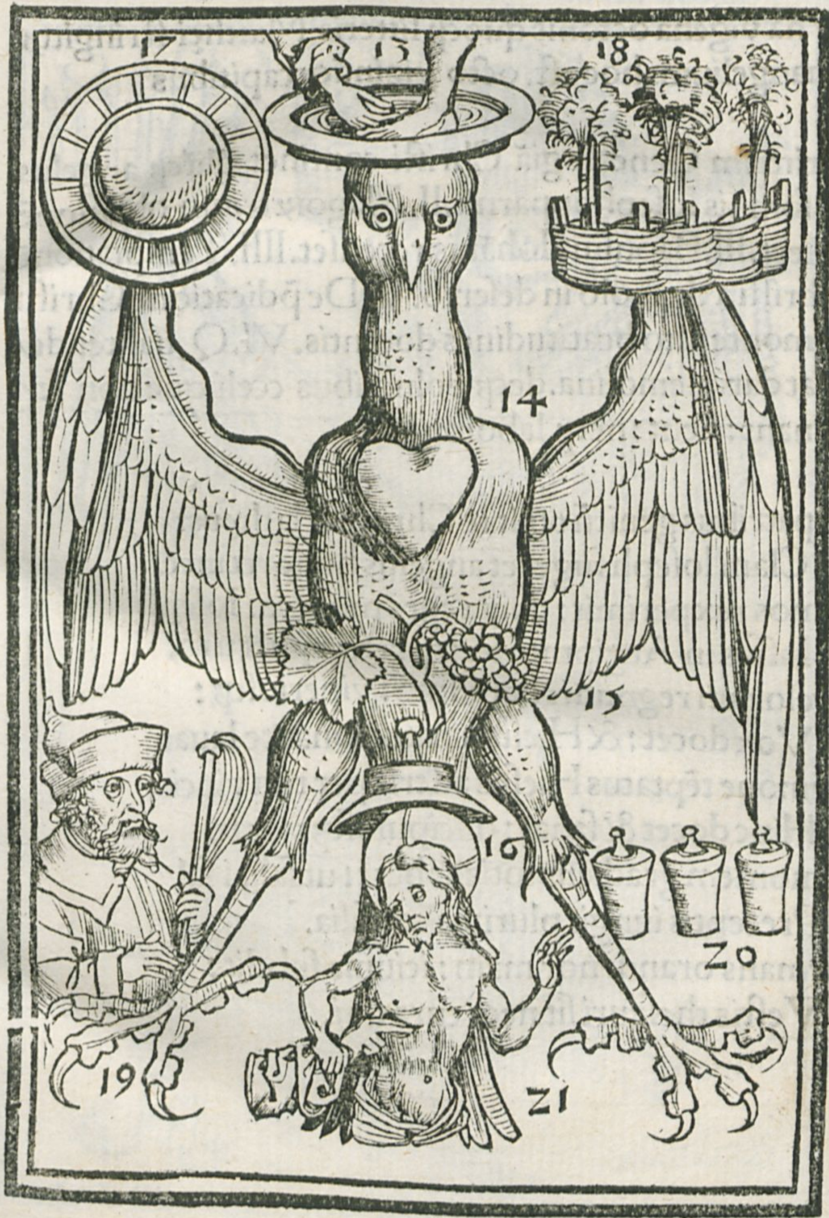
Figura Iohannis Tercia