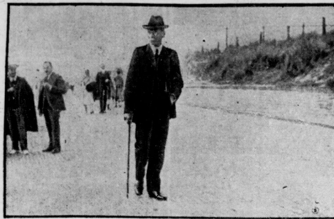
Erzelen von Seedi als Ausgast auf der Strandpromenade in Korbenev.