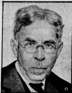
Ein amerikanischer Kirchenführer in Deutschland.

In der Dresdener Straße in Hosterwitz (Kreisamt Sachsen) befindet sich das alte Weberhaus, in dem Karl Maria von Weber wohnte und den „Freischütz“ und andere Werke komponierte.