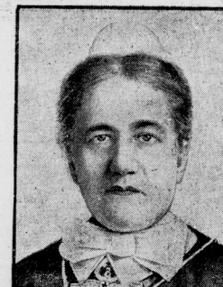
Eine internationale Auszeichnung für eine deutsche Frau.