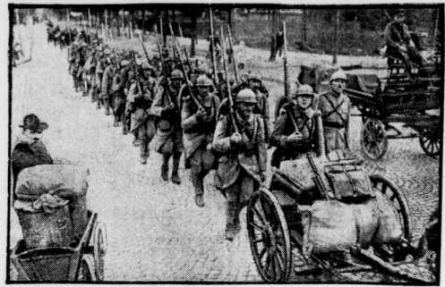
Die letzte Abteilung französischer Infanterie, die Stadt Ehen verlassen.