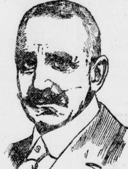
Senator Dr. Patersohn-Hamburg, des neuverordneten des demokratischen Partei ausflusses.