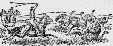
Jagd auf Strauße. (Illustrationsprobe aus Darwin.)