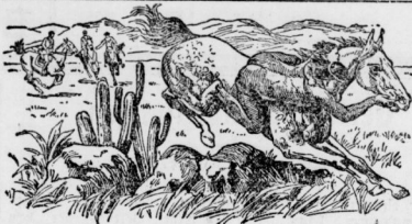
Die Flucht des Katzen. (Illustrationsprobe aus Darwin.)

Dieses höchst lehrreiche und unterhaltende Buch verdient, wie kaum ein anderes, der heranreifenden Jugend in die Hand gedrückt zu werden. Der Herausgeber ist von dem Vorhaben ausgegangen, die Reisebilder aus folche unter Ausscheidung alles rein Wissenschaftlichen und Problematischen — der Darwinismus wird mit feiner Silbe bestrahlt, da Darwin zu jener Zeit seiner Theorie noch fremd gegenüber stand — zur vollen Geltung zu bringen. Darwins Beobachtung ist an romanhaften Einzelheiten und überaus feinen Beobachtungen so reich, daß man sie wie ein echtes literarisches Hauptwerk stets mit innerem Gewinn aufs neue lesen wird. In Bezug auf Genauigkeit des Beobachtens und Sorgfalt des Penséens ist dieses Reisegebuch geradezu von erzieherischem Wert. Der Reisebildende Darwin befriedigt nicht nur das Phantasieverlangen nach fernem Ländern und unterhaltenden