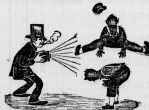
Photo-Apparate und Bedarfsartikel

kaufen Sie vorteilhaft und fachgemäß bei