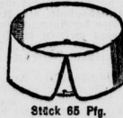
Stück 65 Pfg.

Spachtel-Vitragen u. Spachtel-Kanten etc. etc.