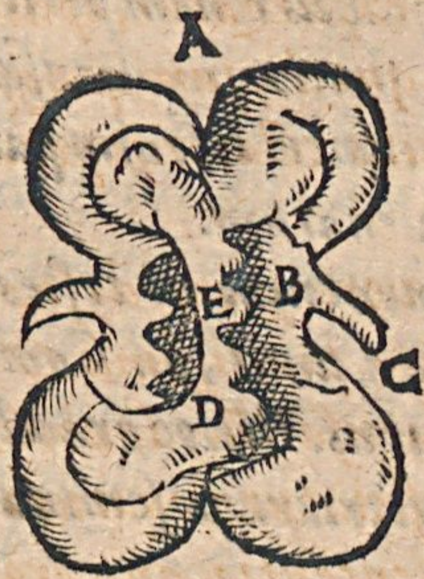
Figura hæc renis interiora & penetralia exhibet.

A. Ren parte sui resima per medium, dissectus sub ijcitur, quò pandi me- lius parietes & intro- spici penetralia possint.