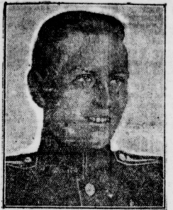
Kronprinz Olaf von Norwegen und Prinzessin Marika von Schweden haben sich verlobt.