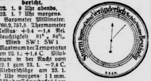
Wettervorhersage am 23. Januar 1923.

Das Jugend- und die Kunstwerkstätten Giebichenstein. Wie aus dem heutigen Interat ersichtlich, soll das hallische Müllleben vor einem schmerzlichen Verfall bewahrt werden.