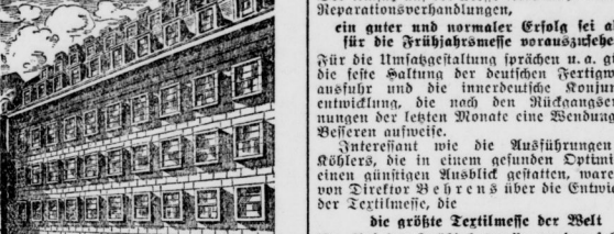
Das Wehant eröffnet einen betriebliebenden Verkauf. — Große Erweiterungsarbeiten.