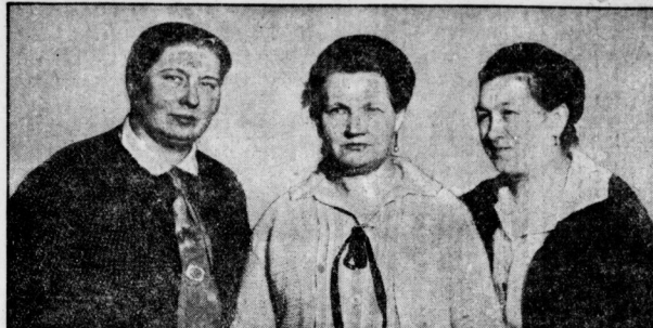
Unser Bild zeigt die Siegerinnen des hallischen Wettkochens...