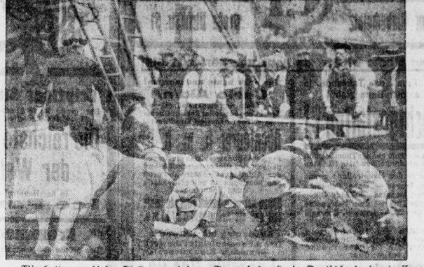
Wir hatten an dieser Stelle vor einigen Tagen das erste in Deutschland eingeflossene Bildtelegramm von dem furchtbaren Geschehen in Cleveland nach Frankfurt am Main. Heute zeigen wir unseren Lesern die erste mit der Schiffspost hier eingeflossene Aufnahme von der Bergung der Toten und Verwundeten.