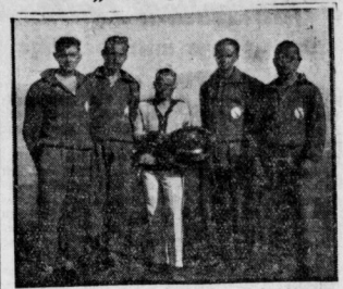
Deutscher Arbeiter-Verein hielt am Sonntag auf der Ruder-Nagata in Neu-Hannoch im Vestingensdamer See ein Rennen...