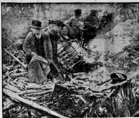
Von dem folgenschweren Unglück des deutschen Junfermanns D 903, das in der Nähe von London abfuhr, und wobei sieben Personen ihren Tod fanden, liegt jetzt das erste Originalbild vor.