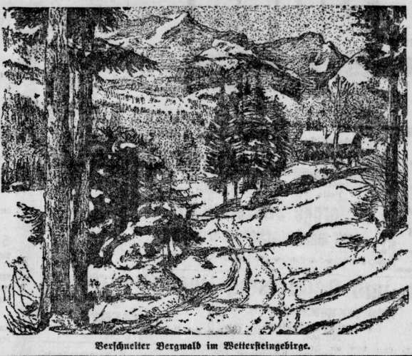
Besucher der Bergwelt im Wettersteingebirge.