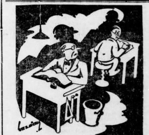
„Haben Sie diese Nacht meinen Rat be-... folgt?“