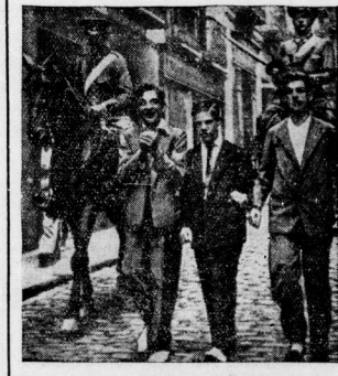
Streifenbild aus Madrid: Verirrte Polizeipatrouille, die verfehlte Demonstration zur Wache bringt.