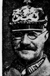
Der verstorbene Prinz Alfonso von Battenberg.

Ein Toter. — Für 100 000 Mark Sachschaden. 500 Inhafteten des Gefängnisses in Dorchester haben einen Aufruhr unternommen, bei dessen Unterdrückung durch kanadische berittene Polizei ein Gefangener getötet wurde. Mehreren Straflingen gelang es zu entkommen. Die Gefangenen müssen haben alle Einrichtungen des Gefängnisses kurz und klein geschlagen und dabei für rund 100 000 Mark Schaden angerichtet.