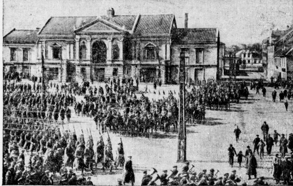
Litauische Truppen 1923 vor dem Stadttheater in Memel.

Memelgebiet Selbstverwaltung gewährt. Die Litauer haben dieses Hofkommen niemals ernst genommen. Vielmehr wurde die Unterwerfung dieses Gebietes mit allen Mitteln betrieben, und trotz der erdrückenden Mehrheit der Memelländischen Landtags waren die Regierenden meistens die Litauer. Man konnte Hände füllen, wollte man die Leiden der Memelländer in der letzten zehn Jahren schildern. Trotzdem ist das Land deutsch geblieben, wie die Landtagswahl im vorigen Jahr bewies. Damals wurden 700 litauischen Wähler von 20 Abgeordneten nur 5 Litauer gewählt. Wenn die Litauer auch große Siegesfälle am 15. Ja-