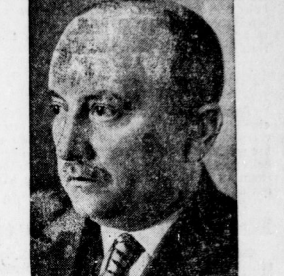
gerechtigt ist? Bestehen diese Verdienste etwa in der Zahlung der 30 000 RM. an das Landesministerium, von der der „Generalanzeiger“ gerichtliche berichtet?