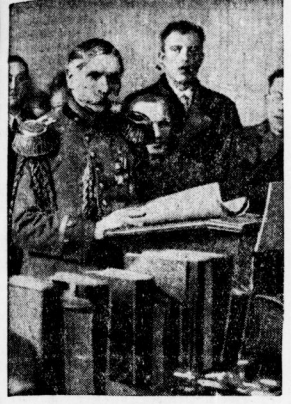
Der „König von Albanien“ vor Gericht.