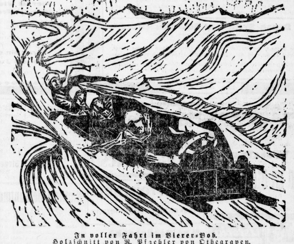
In voller Fahrt im Riesen-Roll. Holzschnitt von H. Richter von Eibergaven.

Unfall während der Konzertprobe. Die beiden Mannschaften in der ersten Runde zurück, dafür riefen die groß führenden Athleten auf den zweiten Platz von dem ersten Rang ab.