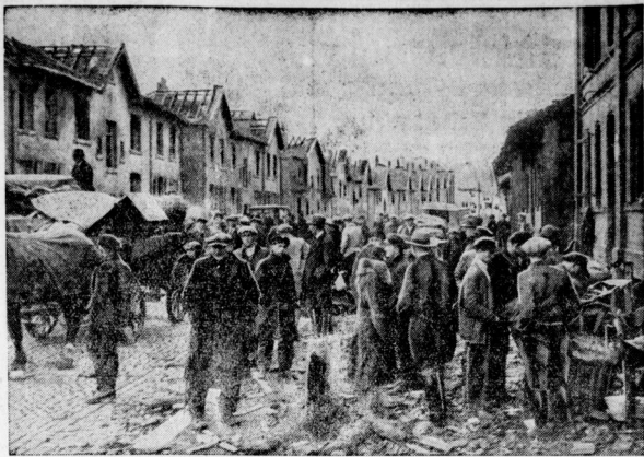
In den Straßen der zerstörten Stadt Reutlingen. Eine Straße der Unglücksstadt Reutlingen: durch den gemaltigen Luftdruck sind hier sämtliche Dächer abgedeckt worden.

Abschließend sagte Hitler, daß er von ganzem Herzen mit England zur Förderung des Weltfriedens zusammenarbeiten und bei niemandem Anstoß erregen wolle, wenn sich dies vermeiden lasse. Er benutzte Staatsleute vom Schlane Cromwells, und Deutschland brauche einen Cromwell, um aus dem gegenwärtigen Zustand dauernder Gefahren und Schwierigkeiten heraus zu einem neuen Zeitalter der Wohlfahrt und des Friedens geführt zu werden.