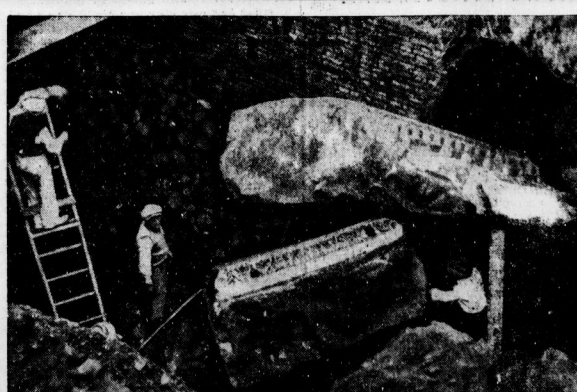
Die neuesten Ausgrabungen in Rom. Bei den Ausgrabungen sind kürzlich auf dem Forum Celso...