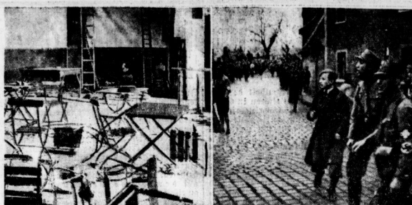
Der blutige Strahlenkampf in Eisleben. Links: Blick in die vernichtete Turnhalle; rechts: SA-Weite am Schauspiel der Turnhalle.

Am Dienstag fand in Budapest die Befehle Graf Albert Appony's statt.