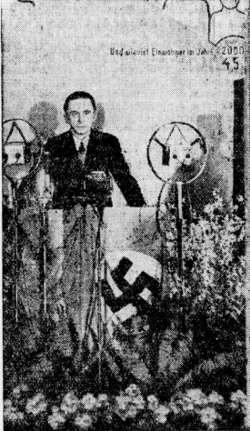
Reichsminister Dr. Goebbels bei der Eröffnung der Ausstellung „Die Frau“ am Rajerdamm in Berlin.