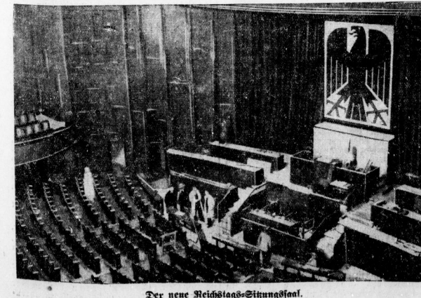
Der neue Reichstags-Sitzungslokal.