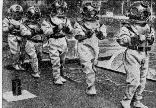
Von der Landwehrschule der Reichsmarine in Kiel. Lustige Parade der Landwehr an Bord des Landwehrschiffes. Auf jedem Kriegsschiff müssen drei bis vier Matrosen und ein Offizier ausgebildete Landwehr sein. Drei Matrosen sind dies schwer, ein gefährliche Zeitkitt. Später legen sie allmählich eine Pflichtübung ab und in jedem Jahre einmal eine große Übung, die über eine Stunde dauert.

Einige der fettsamen Schulen erfreuen sich eines besonders guten Rufes, und sie dürfen