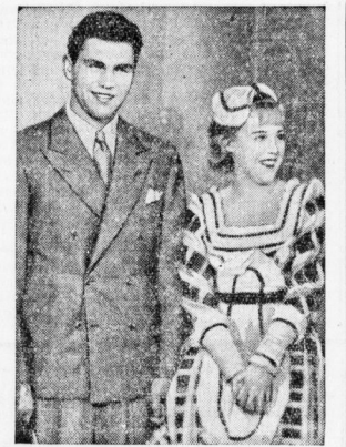
Das Brautpaar Max Schmeling und Anny Duda.