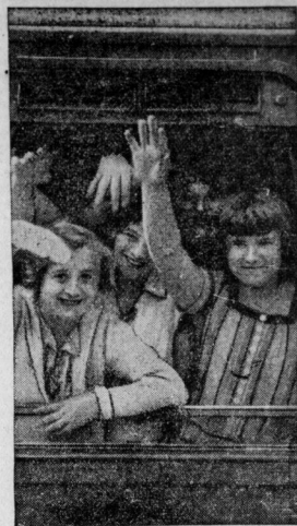
Surra, Ferien! Start ins Paradies der Freiheit.

belebte und ihr Vaterland rettete. Der Großmeister Balduin-Mohammed, ein vorzüglicher Heerführer, erlaß den Reiten der Königin Judith-Katharina, die mit Schmutz und Gold beladen nachts in seinem Lager erschien und den Fürsten zu fesseln mußte. (Fortsetzung folgt.)