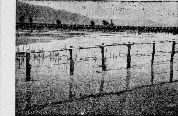
Mussolinis Städtebau auf Nierberflüssen. So sah es noch im Jahre 1930 im Gebiet der Pontinischen Sümpfe aus.

Das Flugzeug hat mich in einem einzigen Zug von Oran nach Niamey zurückgebracht. Von dort bin ich auf einem präfranzösischen Flußschiff nach Senegal, der Hauptstadt des Senegal. Auf dieser Strecke fließt der Fluß träge, fast tot durch eine weite Ebene. Ab und zu ein Flußufer, häufiger solche Arabische Inseln in der Wasserfläche auf und beteten den Strom, der durch ein kompliziertes Netz von Kanälen sich hindurchwindet. Der Djenne verbreitert sich der Fluß zu einer ungeschönten Wasserfläche und in ihm spiegelt Senegal, die alte Hauptstadt, die ihre weichen weißen Mauern. Denn bei jedem Regen werden ihre Häuser, die aus „Banco“ (seiner Art Lehm, der mit Sand untermischt ist) gebaut sind, zerfällt. Eine Klage sehen die Neeger zu, wie sie einführen und unermüdlich bauen sie sie wieder neu auf. Ich benutze den kurzen Aufenthalt des Schiffes, um die wandlungsfähige Stadt zu