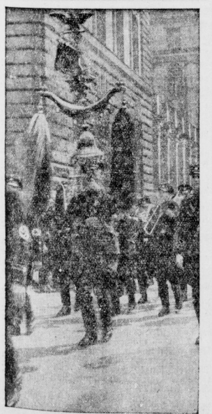
Schellenband der Meer beim S.S. Appell.

Der alte wertvolle Schellenband des 3. A. 24, eines der ältesten maritimen Infanterieregimenter, das ruhmreich an den Feldzügen der letzten 100 Jahre teilnahm und sich im Weltkrieg bei Douaumont besonders auszeichnete, wurde von der Reichswehr der S.S. Gruppe III für den großen Appell in Berlin zur Verfügung gestellt.