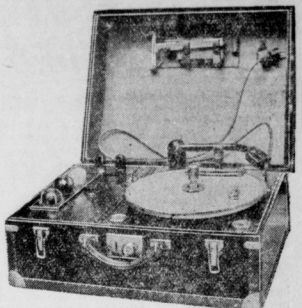
Neues aus der Verkaufsstelle Berlin 1938. Eigene Stimme auf der Tonplatte. Mit diesem kleinen Elektroflügel kann jeder seine Stimme auf die Tonplatte bringen.