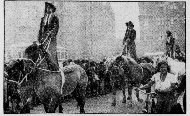
Circus Straßburger, der gegenwärtig auf dem Klopfsplatz in Halle ein Gastspiel gibt...