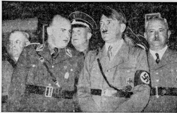
Der Führer auf dem Juristentag.

Wir trinken, machen schnell die schönsten Gruppenaufnahmen von Haus und