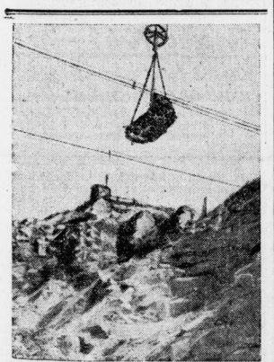
Deutscher Granit für Deutschlands Straßen. Der deutsche Straßenbau gewinnt im Rahmen des Kampfes gegen die Arbeitslosigkeit...

„Die Aussagen des Klägers sind offenbar erlogen“, stellt da Fernemann auf. „Wie kann er behaupten, ich hätte ihn mindestens zehn Schläge gegeben, wenn er schon nach dem ersten Schlag benutzlos wurde?“