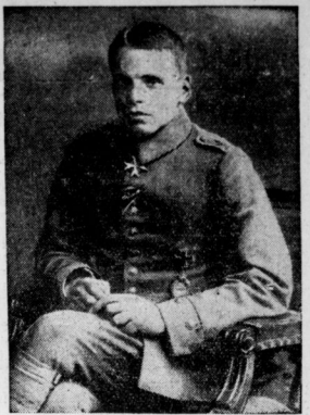
Oswald Voelke, der hervorragende Kampflieger im Weltkrieg, stürzte am 28. Oktober 1918 nach dem Zusammenstoß mit einem anderen Flugzeug an der Westfront ab...