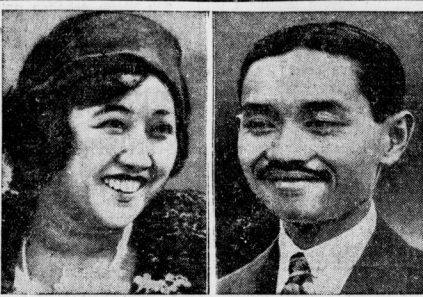
Das flämische Königspaar geflohen.

Ein Fabelwesen. Sie: „Heute habe ich etwas Wunderbares gesehen, vorne Schlang und hinten Krokodil!“