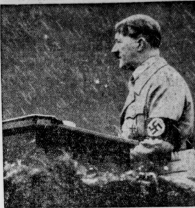
Am Denkmal für Dietrich Eckart. Der Führer bei der Weiberede.

und wieder in der Erde lauff, also ist auch Deutschland mächtig genug von Stärke und Weiten, es mangelt ihm aber an einem guten Haupt und Regenten.