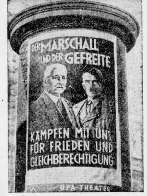
Für den 12. November. Schauplatz für Volksabstimmung und Reichstagswahl.

Deutschland ist wie ein schöner, weidlicher Hengst, der Futter und alles genug hat, was er bedarf.