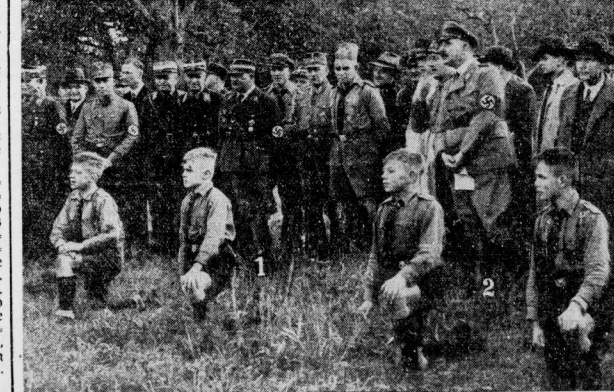
Nationalpolitische Erziehungsanstalt „Ernst Röhm“ geweiht. Stabschef Röhm (1) und Kultusminister Ruit (2) als Zuschauer.

Da schrieb ich einen Brief mit den propositionibus (Thesen) an den Bischof in Magdeburga, vernahmte und hat, er wollte dem Teufel Einhalt tun und wehren, daß sich unchristliche Dinge erebricht würde, es möchte eine Unlust daraus entstehen; solches erbrühr ihm als einem Erzbischof, Deutschen